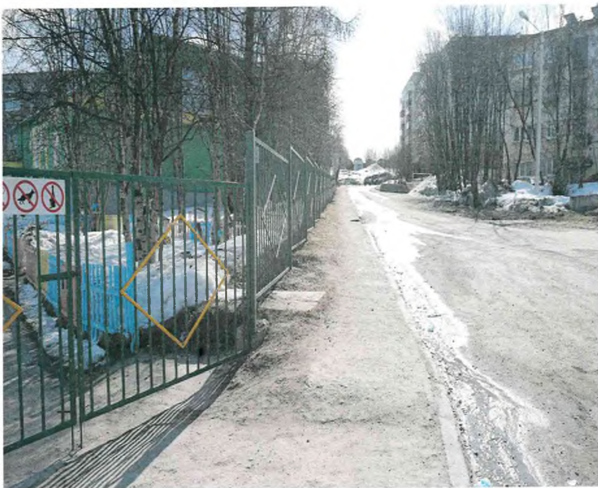
Фото № 1-2: Вход на территорию объекта