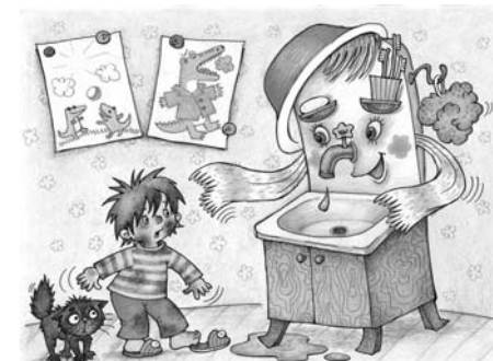
Пример демонстрационного материала из комплекта карточек «Что такое хорошо и что такое плохо».

III. Организационный раздел раскрывает: 1) основные подходы к организации образовательной деятельности в дошкольной образовательной организации; 2) рекомендации по адаптации парциальной программы «Мир Без Опасности» к запросу особого ребенка; 3) особенности взаимодействия педагогического коллектива с семьями воспитанников; 4) примерный перечень материалов и оборудования для создания развивающей предметно-пространственной среды; 5) список учебно-методических и наглядно-дидактических пособий, рекомендуемых для успешной реализации парциальной образовательной программы «Мир Без Опасности».