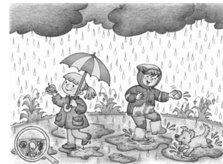
Пример демонстрационного материала из комплекта карточек «Опасные явления в природе» (см. Приложение 1).

В связи с вышесказанным, возникает необходимость четкого выделения целевых ориентиров, задач и содержания образования , направленного на формирование культуры безопасности личности, начиная с