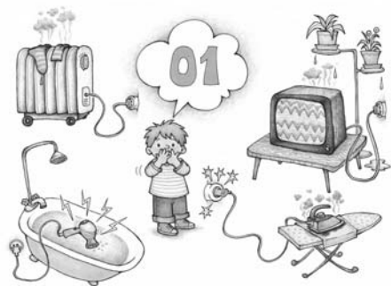
Пример демонстрационного материала из комплекта карточек «Пожарная безопасность» (см. Приложение 1).

Парциальная образовательная программа «Мир Без Опасности» разработана в соответствии с требованиями Федерального государственного образовательного стандарта дошкольного образования (Приказ Минобрнауки России № 1155 от 17.10.2013) и согласована с Федеральным законом «Об обра-